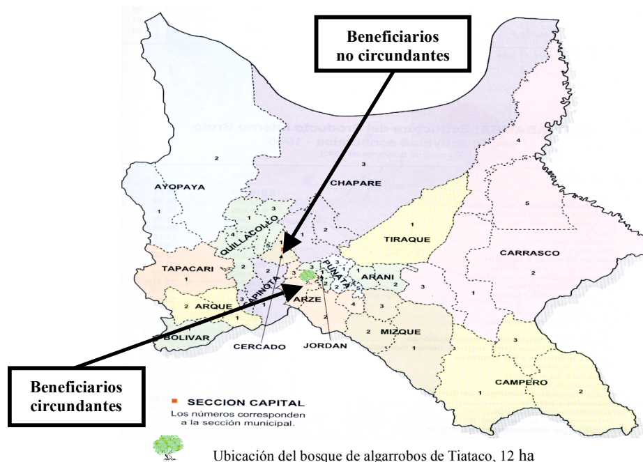
Figura 1. Mapa del departamento de Cochabamba, Bolivia. Se resalta la ubicación geográfica de los beneficiarios circundantes y no circundantes al bosque de algarrobos de Tiataco. INE/MDSP/COSUDE, 1999.

En este estudio de valoración económica del bosque de algarrobos de Tiataco, las familias residentes en la comunidad de Tiataco son consideradas beneficiarios circundantes y las familias residentes en la ciudad de Cochabamba son consideradas beneficiarios no circundantes respecto al recurso (Véase Figura 1).